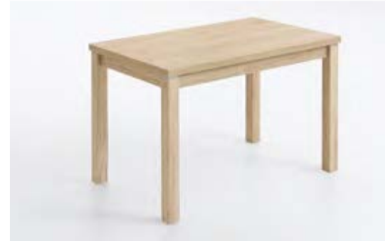
9133-xx-000 / Ausziehtisch, Nachbildung 110 (170) x 70 cm mit zweiseitigem Holzleistenauszug à 30 cm