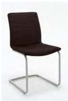
8851-02-27x Schwingstuhl, Rundrohr, Edelstahl gebürstet, Bezug »Bogota« B 46 H 89 T 60 Sh 49 cm