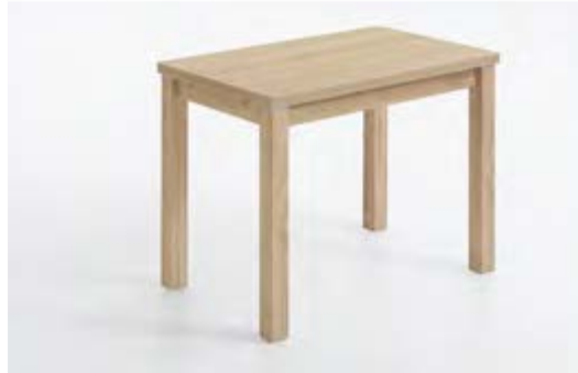
9123-xx-000 / Ausziehtisch, Nachbildung 90 (150) x 60 cm mit zweiseitigem Holzleistenauszug à 30 cm