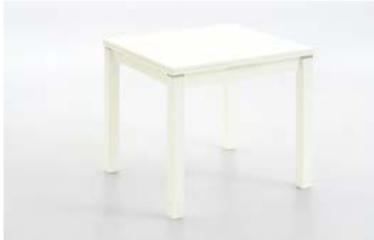
9103-xx-000 / Ausziehtisch, Nachbildung 80 (140) x 80 cm mit zweiseitigem Holzleistenauszug à 30 cm

3 Tischmodelle mit zweiseitigem Holzleistenauszug - 3 Oberflächen - 2 Stuhlmodelle - 2 Bezugstoffe