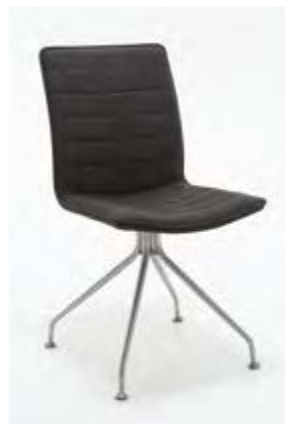
8861-02-27x Stativstuhl, Edelstahl gebürstet, Bezug »Bogota« B 46 H 89 T 60 Sh 49 cm