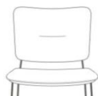
eingezogene Naht im Rücken (Nahtfarbe = Farbe Rückenteil)