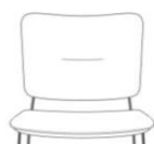
eingezogene Naht im Rücken (Nahtfarbe = Farbe Rückenteil)