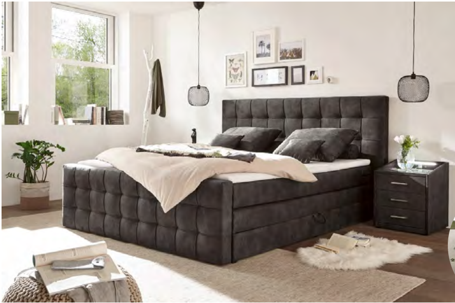
Salvador 04 espresso