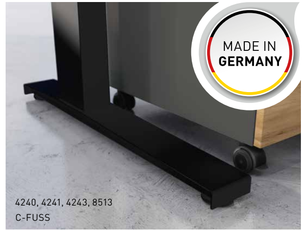
4240, 4241, 4243, 8513 C-FUSS