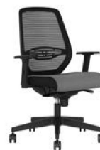
Bürodrehstuhl mit NetZRückenlehne