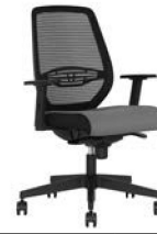
Bürodrehstuhl mit NetZRückenlehne