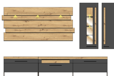
1B J4 GH 80