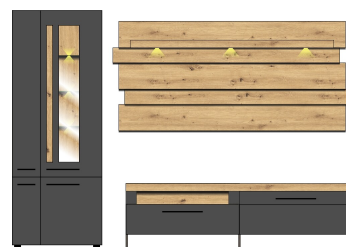
1B J4 GH 81