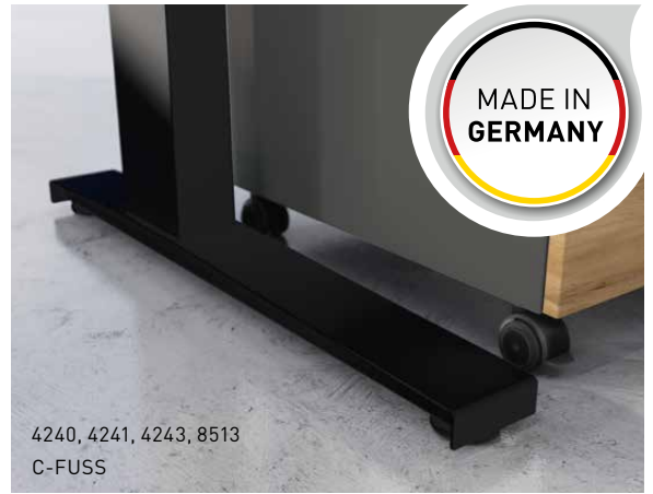
4240, 4241, 4243, 8513 C-FUSS