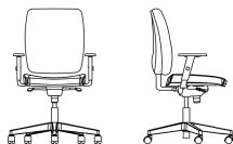
POP SWIVEL CHAIR UPH