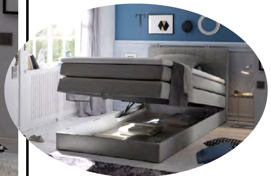
inkl. einem integrierten Bettkasten