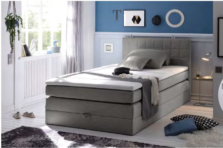
Savanna 21 grau

Boxspringbett 120 x 200 cm mit Bettkasten