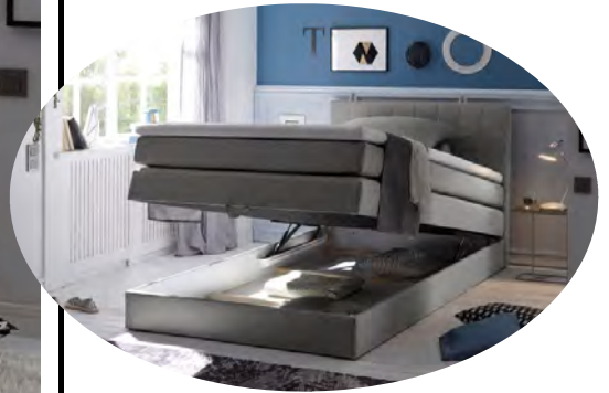
inkl. einem integrierten Bettkasten

Boxspringbett 120 x 200 cm mit Bettkasten