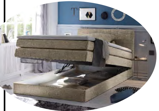
inkl. einem integrierten Bettkasten