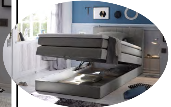
inkl. einem integrierten Bettkasten

Stk. im LKW 80 m 3 43 Anzahl Packungen 4 Logistik Ost DL