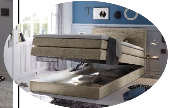
inkl. einem integrierten Bettkasten