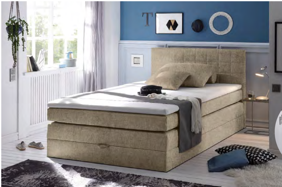
Soro 23 sand

Boxspringbett 140 x 200 cm mit Bettkasten