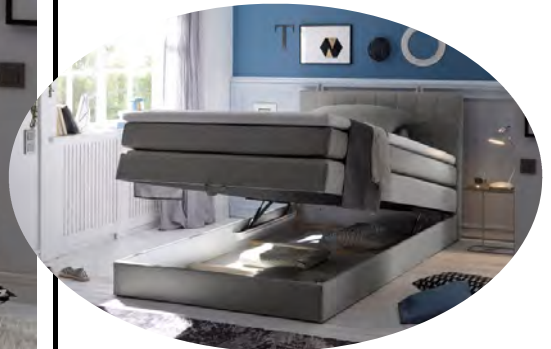
inkl. einem integrierten Bettkasten

Stk. im LKW 80 m 3 43 Anzahl Packungen 4 Logistik Ost DL