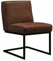
CHAIR WIDTH: 54 cm