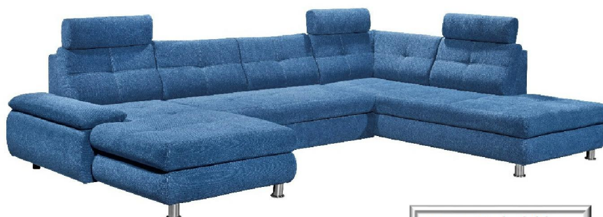
Brego 86 dark blue