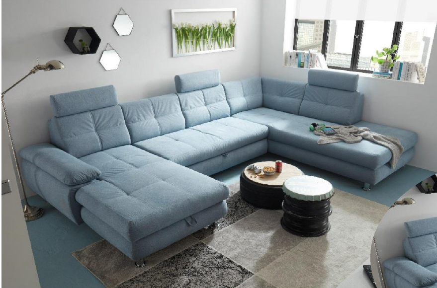
Pegasus 72 aqua