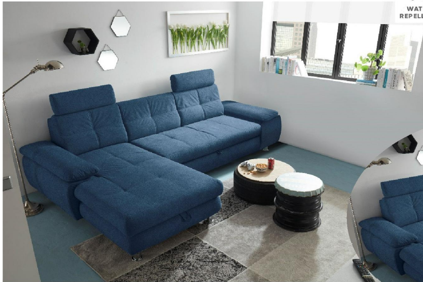
Brego 68 dark blue