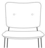
doppelter Knopf (Knopffarbe = Farbe Sitzteil)

Innenrücken versehen mit eingezogener Naht (Nahtfarbe = Farbe Rückenteil) (abweichend bei Bestellung angeben)