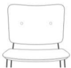
doppelter Knopf (Knopffarbe= Farbe Sitzteil)

Ziernaht Kreuzstich (Natur oder schwarz) entlang der Ränder beim Sitz- und Rückenteil (nicht möglich beim Kiko Plus )