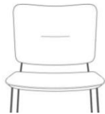
eingezogene Naht im Rücken (Nahtfarbe = Farbe Rückenteil)

Fremdbezug: Leder: 1,25 m 2 oder Rückenteil: 0,65 m 2 | Sitzteil: 0,65 m 2 /