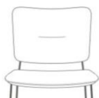
eingezogene Naht im Rücken (Nahtfarbe = Farbe Rückenteil)