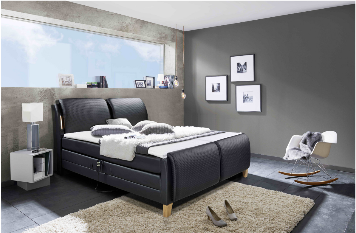
Modell Messina 2