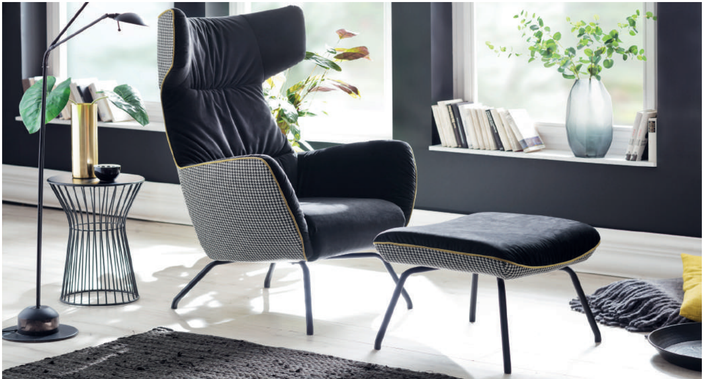
Einzelstuhl + Hocker