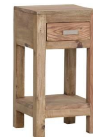
Mindestbestellmenge: 3 Stück 1 Schublade (Innenmaße: B18 T21 H7)