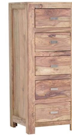
5 Schubladen (Innenmaße: B30 T32 H15)