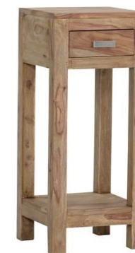
Mindestbestellmenge: 3 Stück 1 Schublade (Innenmaße: B18 T21 H7)