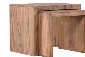
Plattenstärke: 45 mm