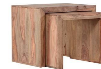
Plattenstärke: 45 mm