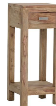
Mindestbestellmenge: 3 Stück 1 Schublade (Innenmaße: B18 T21 H7)