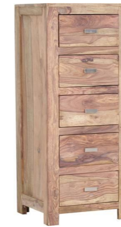
5 Schubladen (Innenmaße: B30 T32 H15)