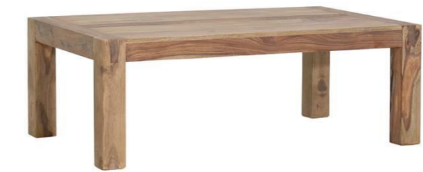
Zarge: 6,4 cm Plattenstärke: 20 mm Stollenstärke: 7,8 x 7,8 cm Lieferung = demontiert