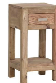
Mindestbestellmenge: 3 Stück 1 Schublade (Innenmaße: B18 T21 H7)