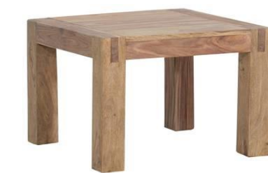
Zarge: 6,4 cm Plattenstärke: 20 mm Stollenstärke: 7,8 x 7,8 cm Lieferung = demontiert