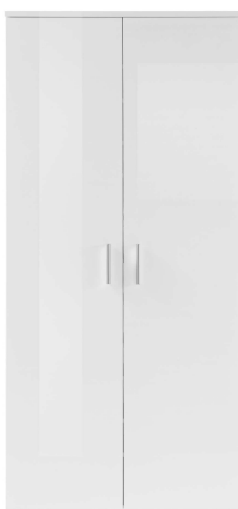
Art.Nr. 33-203-13 Schuhschrank 3 2 Türen - 11 Böden