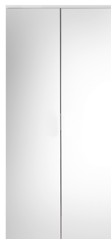
33-204-13 Schuhschrank 4 2 Spiegeltüren - 11 Böden