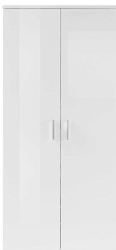
Art.Nr. 33-203-13 Schuhschrank 3 2 Türen - 11 Böden