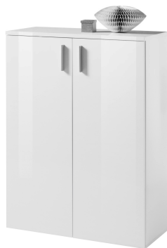
Art.Nr. 33-201-13 Schuhschrank 1 2 Türen - 5 Böden