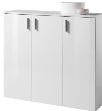
33-202-13 Schuhschrank 2 3 Türen - 10 Böden