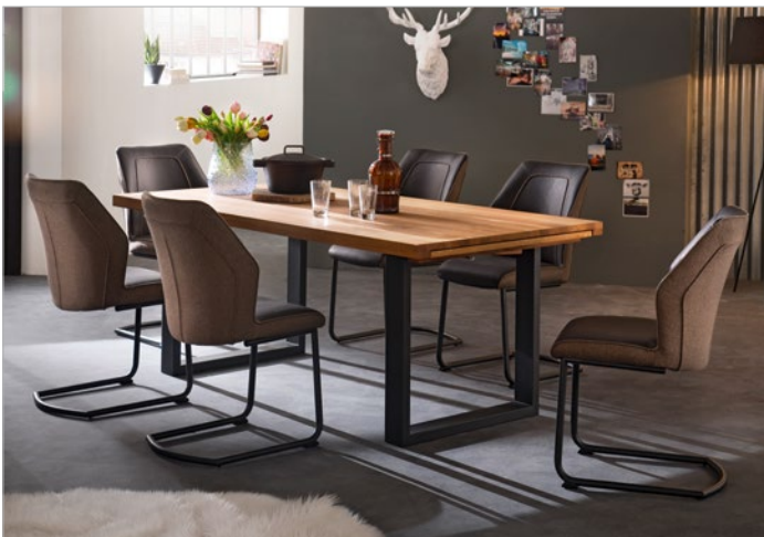
Kufentisch DAYTON mit Schwingstuhl ABERDEEN