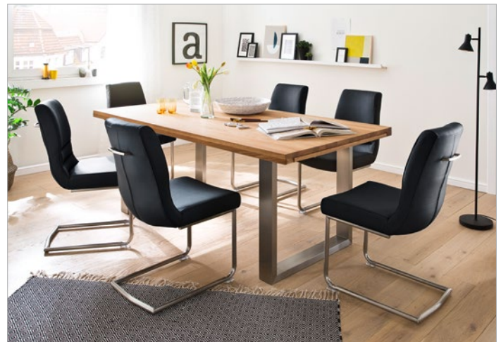
Kufentisch DAYTON mit Schwingstuhl MONTERA