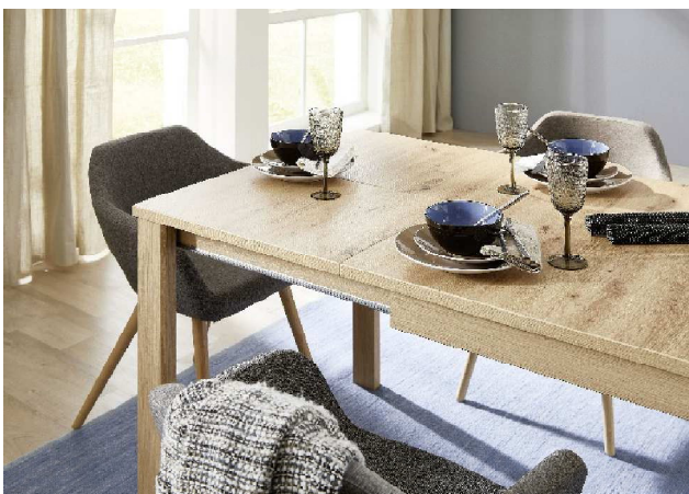
3. Zusammenschieben - Verriegeln - Fertig!

Lieferhinweis: 1 Packstück - Füße müssen vor Ort montiert werden !