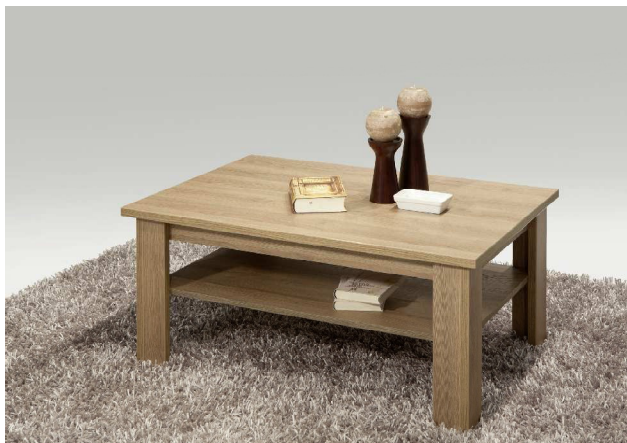
Holzoptik - Couchtisch