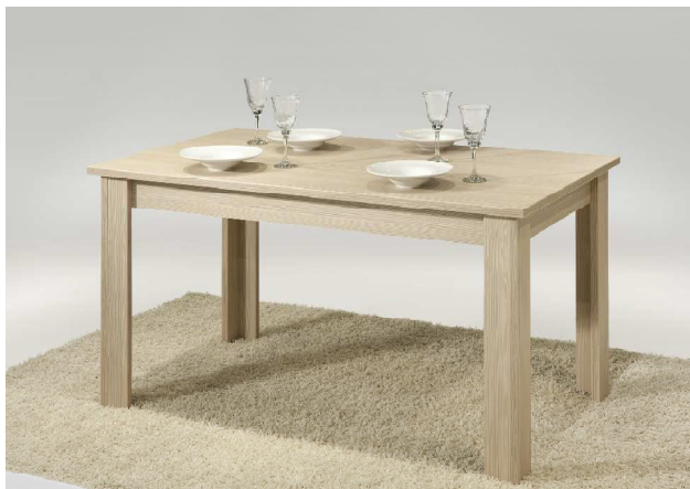
Holzoptik - Esstisch