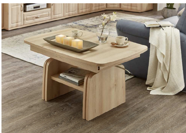
Couchtisch mit Funktion