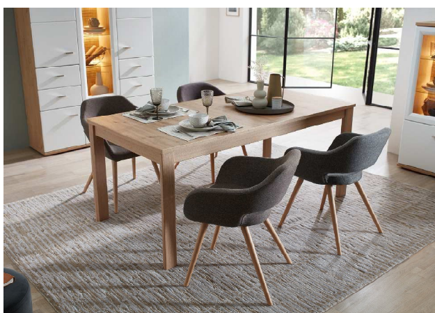
Esstisch mit Funktion