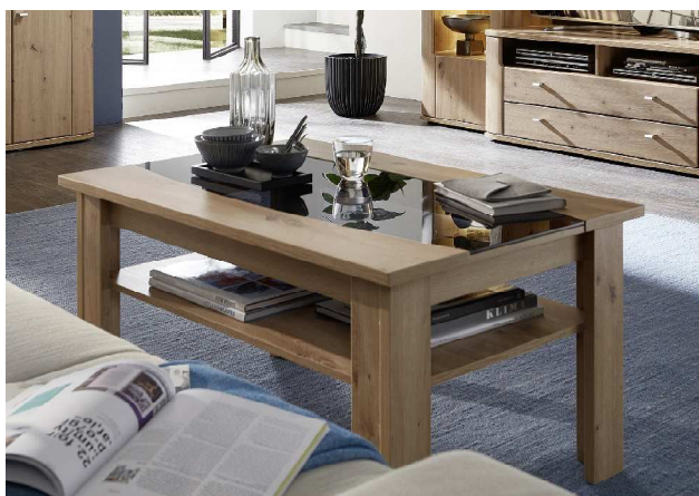
Glaseinsatz - Couchtisch