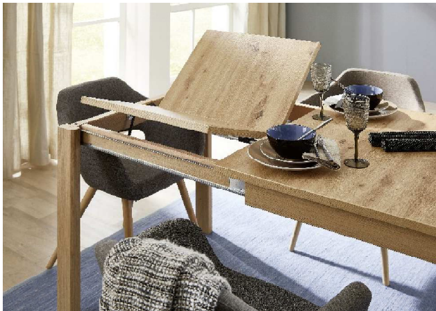
2. Einlegeplatte ausklappen