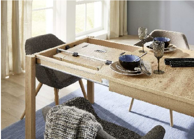
1. Gestell ausziehen

TEF...in der Breite um 60 cm erweiterbar durch eine ausklappbare Einlegeplatte (Butterfly)