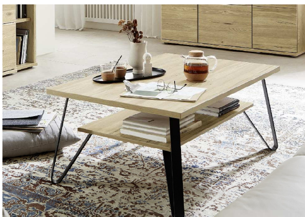
Metallgestell - Couchtisch