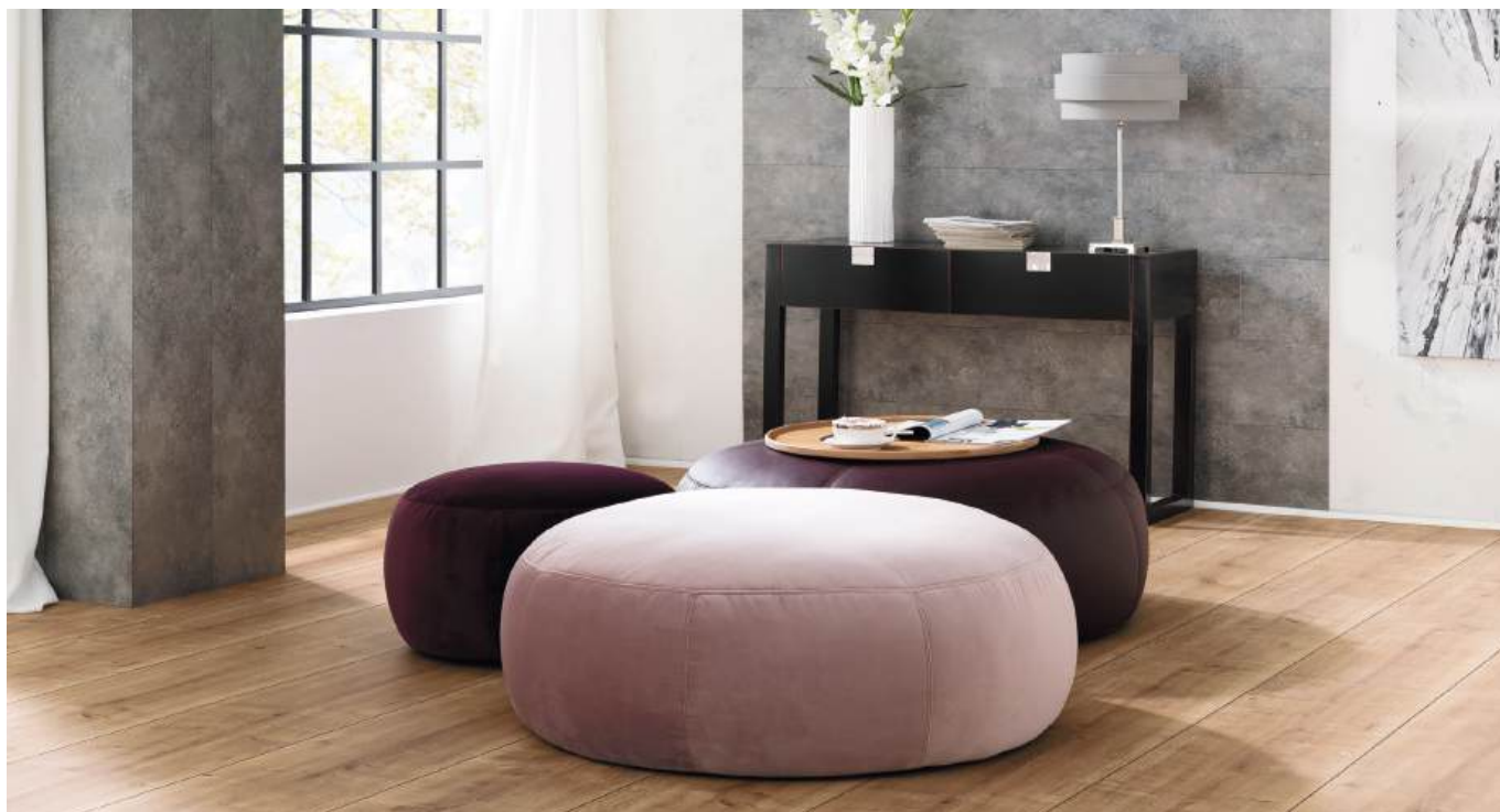
Hocker rund (Ø 105 cm) - Hocker rund (Ø 60 cm)