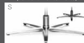
Metall-Sternfuß schmal - verchromt - Edelstahloptik - Anthrazit (pulverbeschichtet)