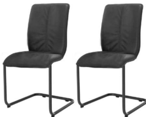
814P plus (rund)

Tara 814P / 817P plus - Bi-Color Polsterung*