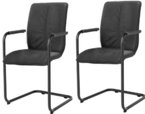
824P plus (rund)