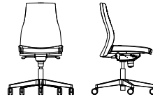
VIDEN SWIVEL CHAIR MB UPH