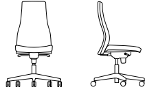
VIDEN SWIVEL CHAIR HB UPH