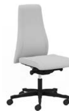
mittelhohe, gepolsterte Rückenlehne