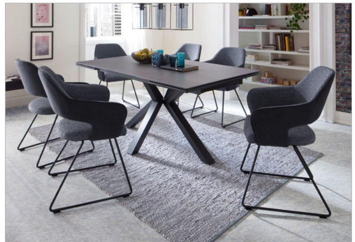
Tisch NAGANO mit Stuhl NEWCASTLE