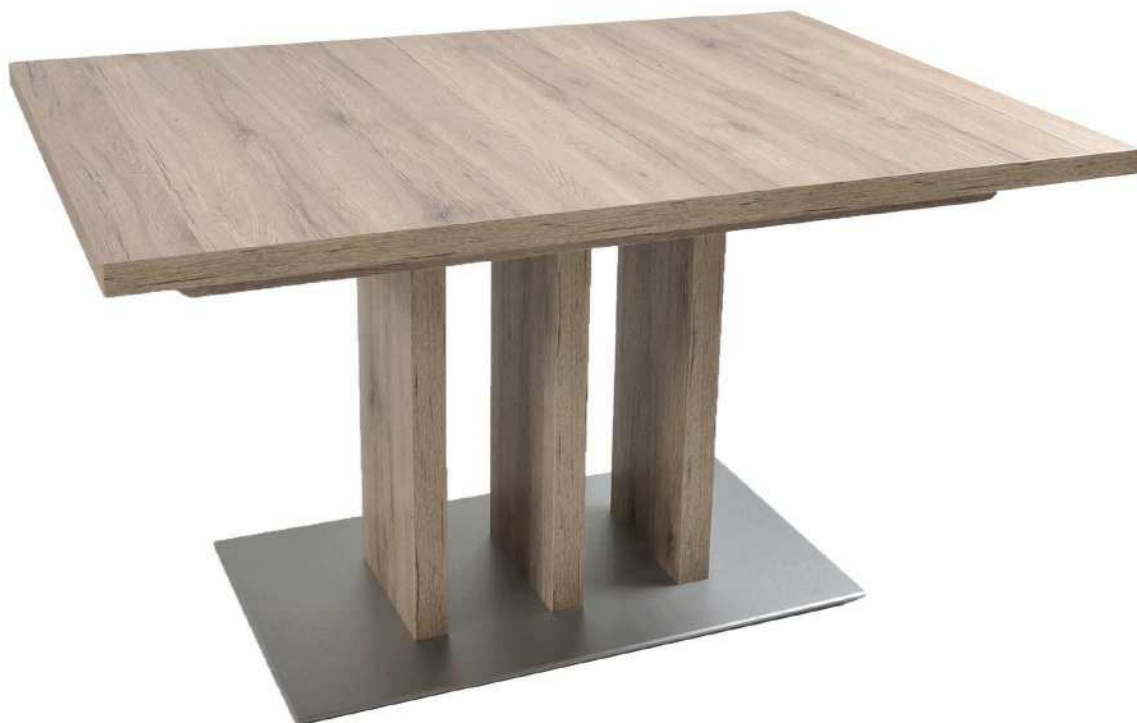
Abbildung 2B Funktionstisch, Nachbildung San Remo Eiche grau