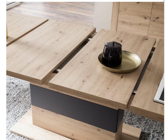
Esstisch mit Synchronauszug