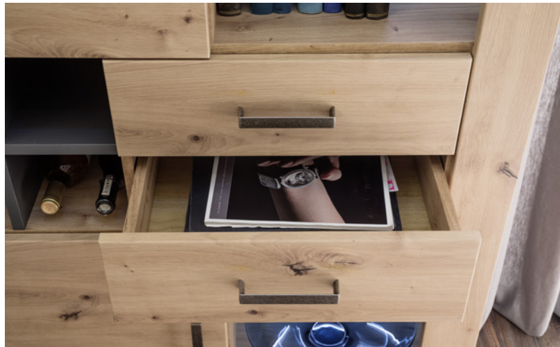
Schubkästen mit Unterflurführung gedämpft