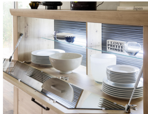
Highboard mit Klappe