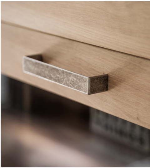
Metallgriffe aus Alt Nickel