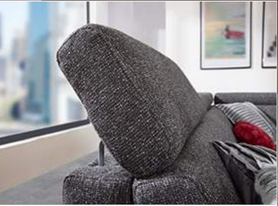
Zahlreiche Kombinations- und Bezugsvarianten möglich!