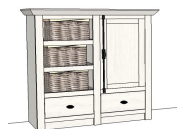
6P PX 20 54