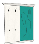
6P PX 20 74