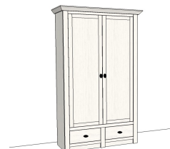
6P PX 20 27