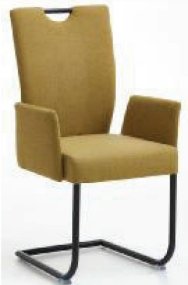
3065-00-92x Armlehnen-Set für Montage an Modell 3061- Bezug "Florida" 1 Set / Verpackung