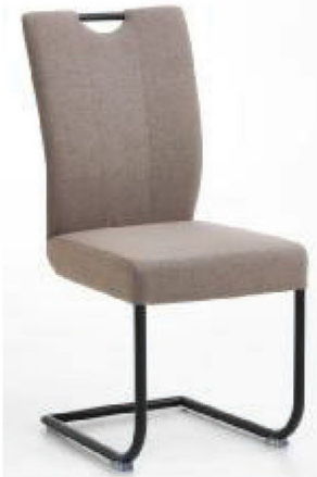
3061-04-92x Schwingstuhl mit Griff Gestell Rundrohr, Eisen schwarz mit Wellen-Federung im Sitz Bezug "Florida"