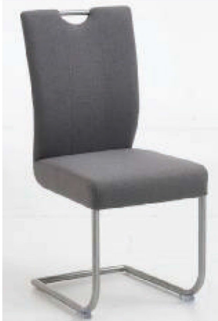
3061-02-92x Schwingstuhl mit Griff Gestell Rundrohr, Edelstahl gebürstet mit Wellen-Federung im Sitz Bezug "Florida"