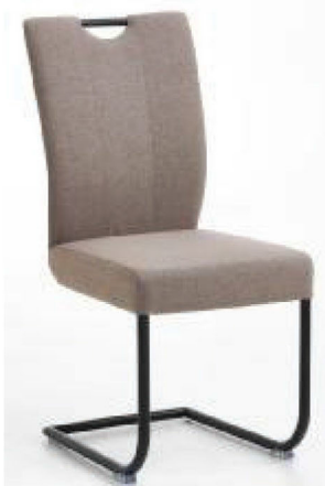
3061-04-92x Schwingstuhl mit Griff Gestell Rundrohr, Eisen schwarz mit Wellen-Federung im Sitz Bezug "Florida"