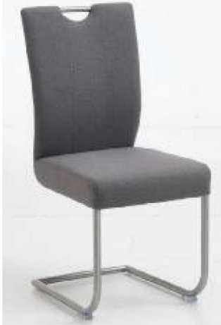
3061-02-92x Schwingstuhl mit Griff Gestell Rundrohr, Edelstahl gebürstet mit Wellen-Federung im Sitz Bezug "Florida"