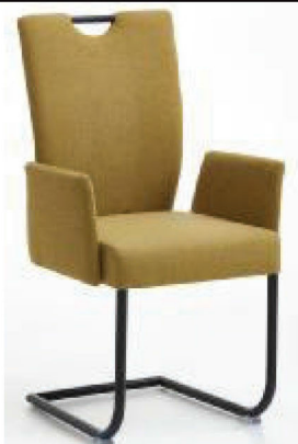
3065-00-92x Armlehnen-Set für Montage an Modell 3061- Bezug "Florida" 1 Set / Verpackung