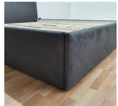
Bettkasten zerlegt (NEU)