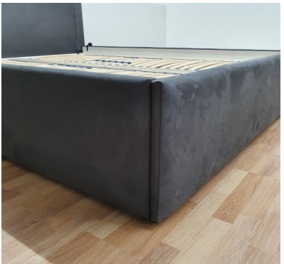
Bettkasten zerlegt (NEU)