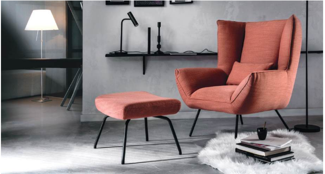
Sessel und Hocker