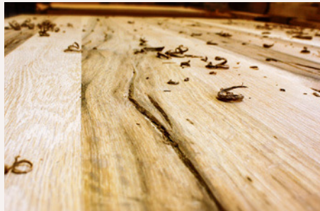
Grob ausgearbeitete Risse