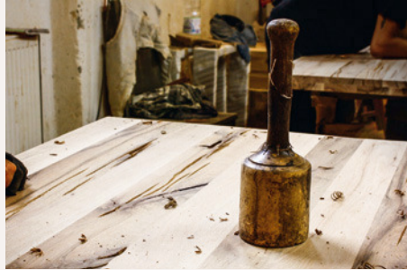
Blick in die Tischlerei