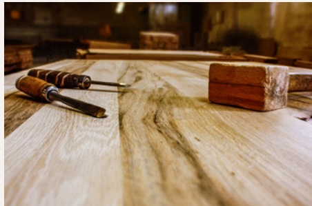
Traditionelle Werkzeuge für die handwerkliche Bearbeitung