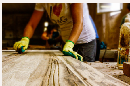
Schleifen eines zuvor ausgearbeiteten Risses