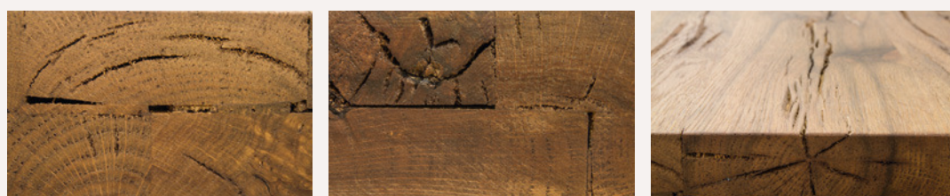
Merkmale der Stirnseiten der Deckplatten