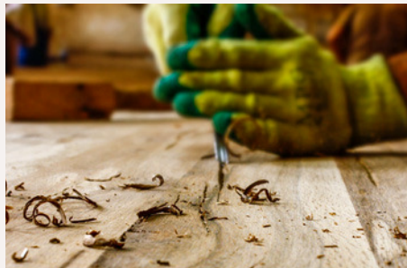
Ausarbeitung der Risse in Handarbeit mit Stechbeitel