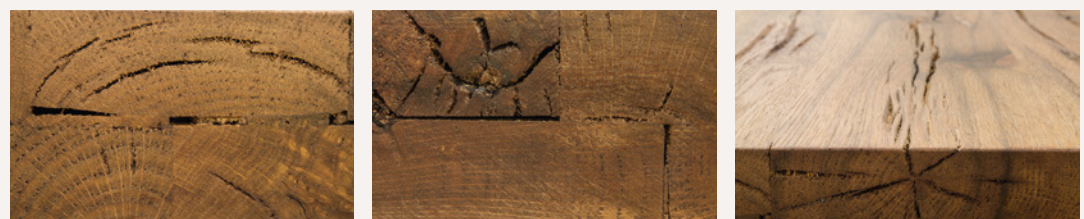
Merkmale der Stirnseiten der Deckplatten