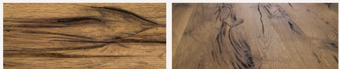
Merkmale in der Fläche der Deckplatten