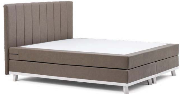
BSM2.02-06-03-F90 Matratzen Härtegrad: H2/H3 Matratzenbezug: BS18VB-F90