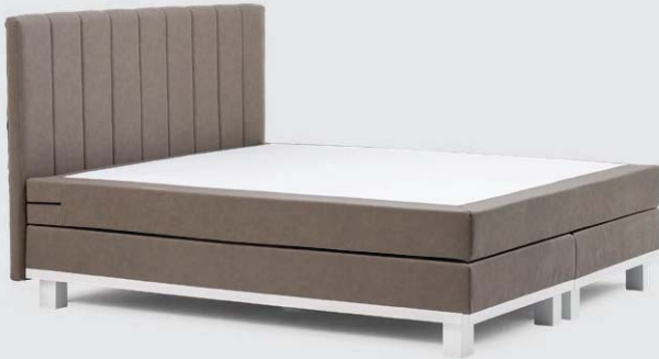
BSM2.00-06-03-F90 Matratzen Härtegrad: H2/H3 Matratzenbezug: BS18VB-F90