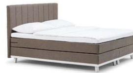
MIT TOPPER TP05