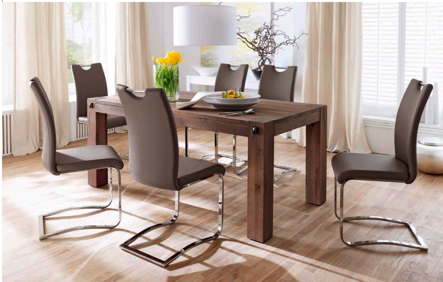
Tisch LEEDS mit Schwinger KÖLN