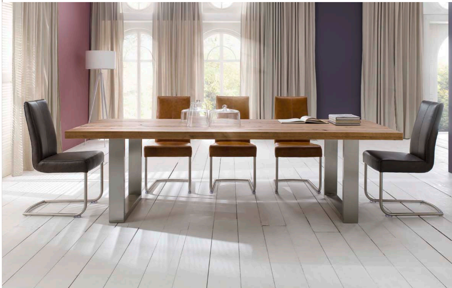
Tisch CASTELLO mit Schwinger FLAIR