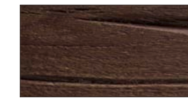
..... V - verwittert / lackiert