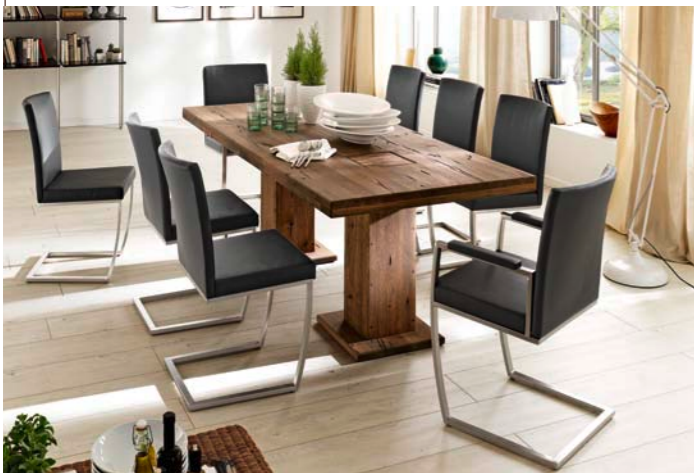
Tisch MANCHESTER mit Schwinger VICTORIA