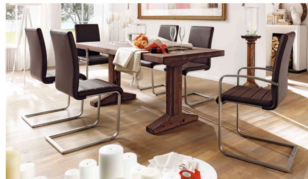
Tisch LUNCH mit Schwinger PHÖNIX