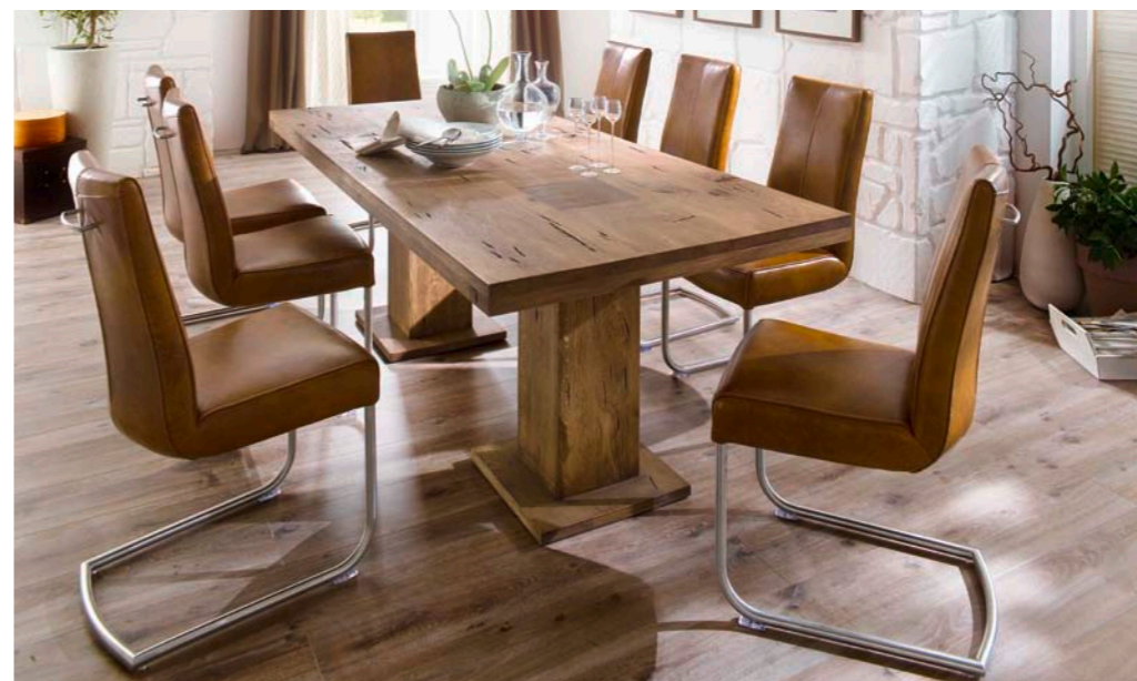
Tisch MANCHESTER mit Schwinger FLAIR