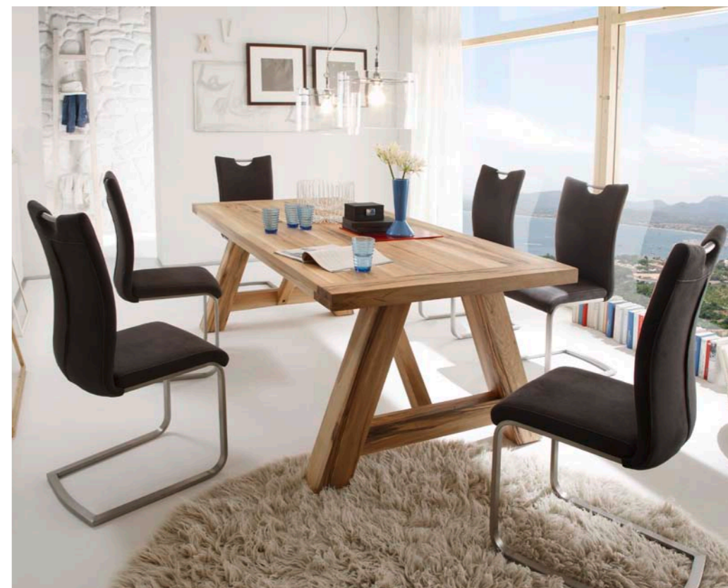
Tisch BRISTOL mit Schwinger PAVO Antik