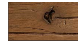
..... B - bassano / lackiert