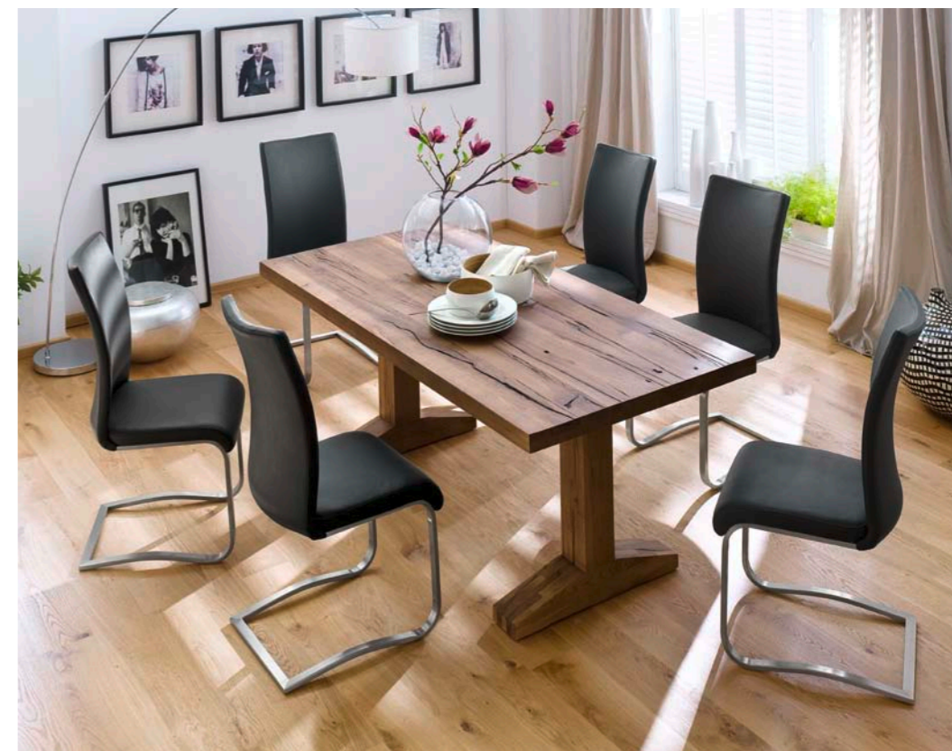
Tisch LUNCH mit Schwinger ARCO