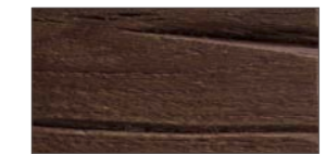
..... V - verwittert / lackiert