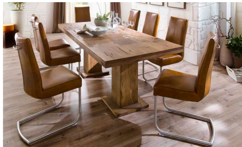
Tisch MANCHESTER mit Schwinger FLAIR