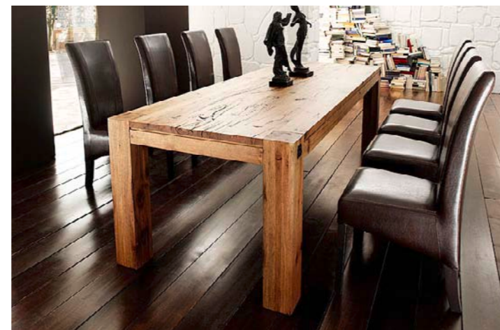
Tisch LEEDS mit Polsterstuhl FIDELIO