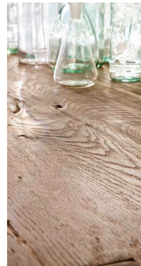
Tisch DUBLIN mit Schwinger LOTTE