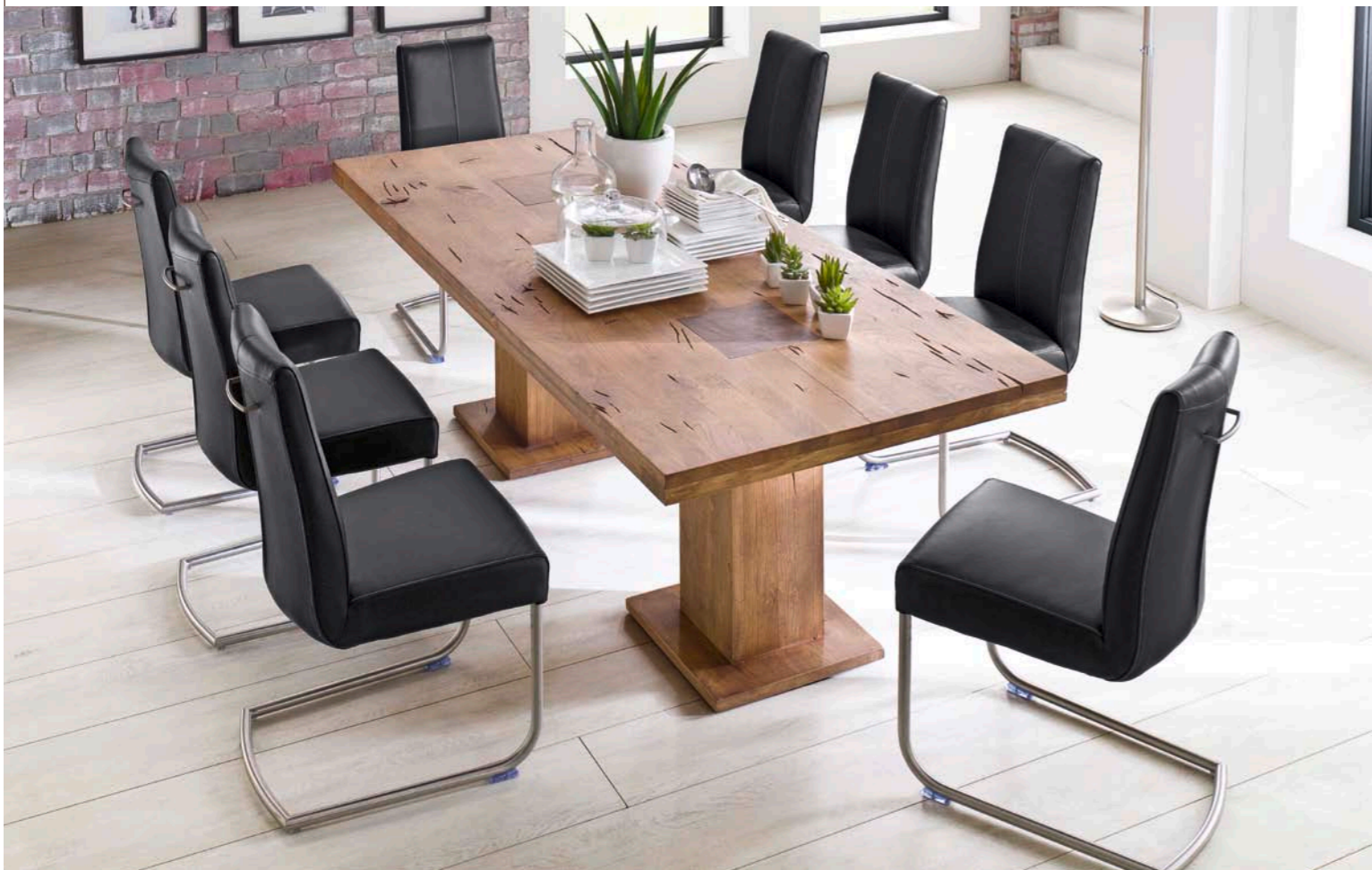
Tisch MANCHESTER mit Schwinger FLAIR