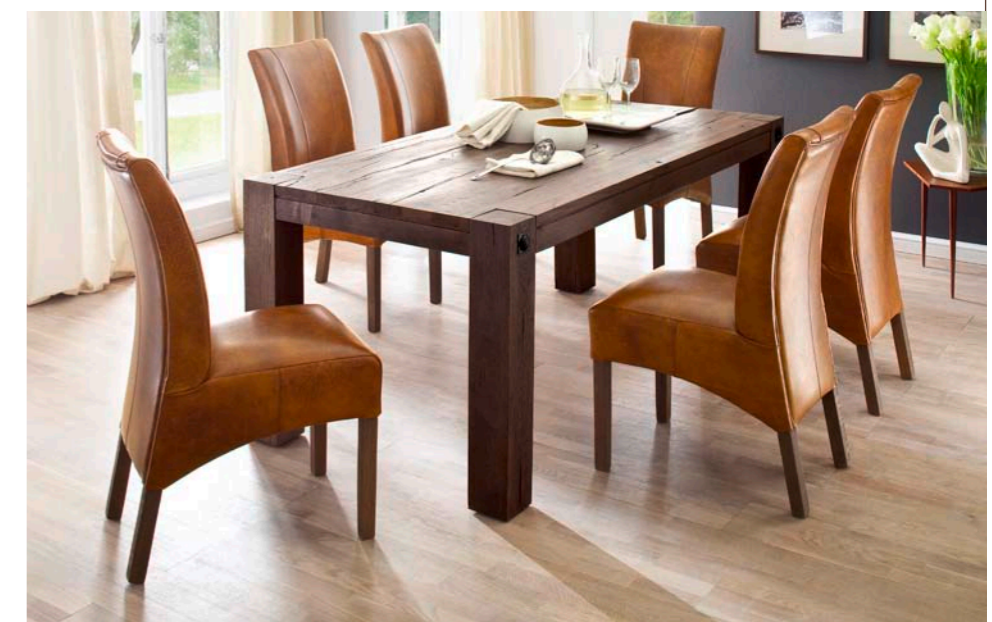
Tisch LEEDS mit Polsterstuhl FLORA