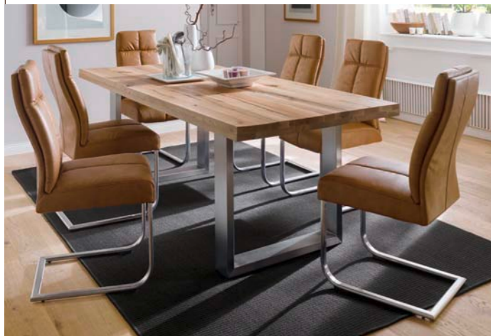
Tisch CASTELLO mit Schwinger LOUNGE C