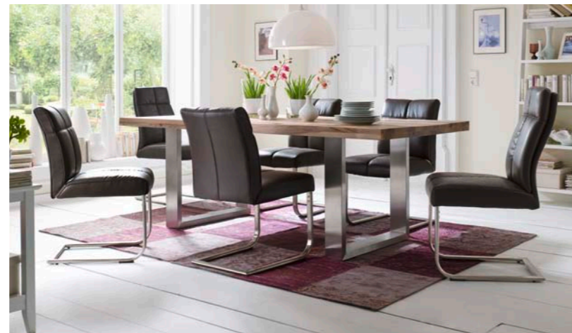
Tisch CASTELLO mit Schwinger LOUNGE A/B/C