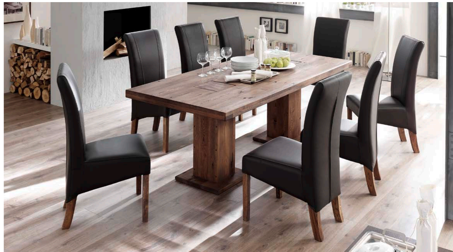
Tisch MANCHESTER mit Polsterstuhl FIDELIO