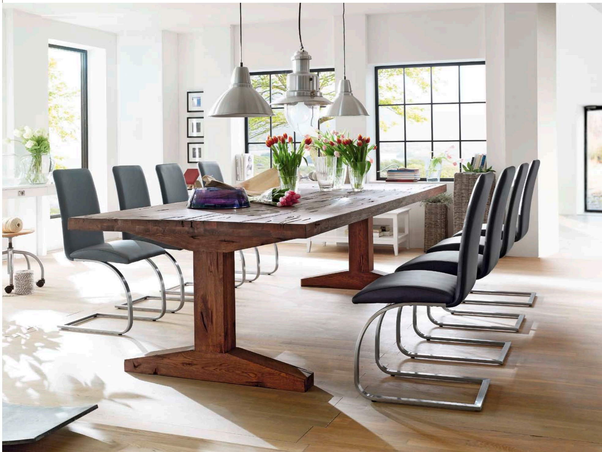
Tisch LUNCH mit Schwinger MAUI