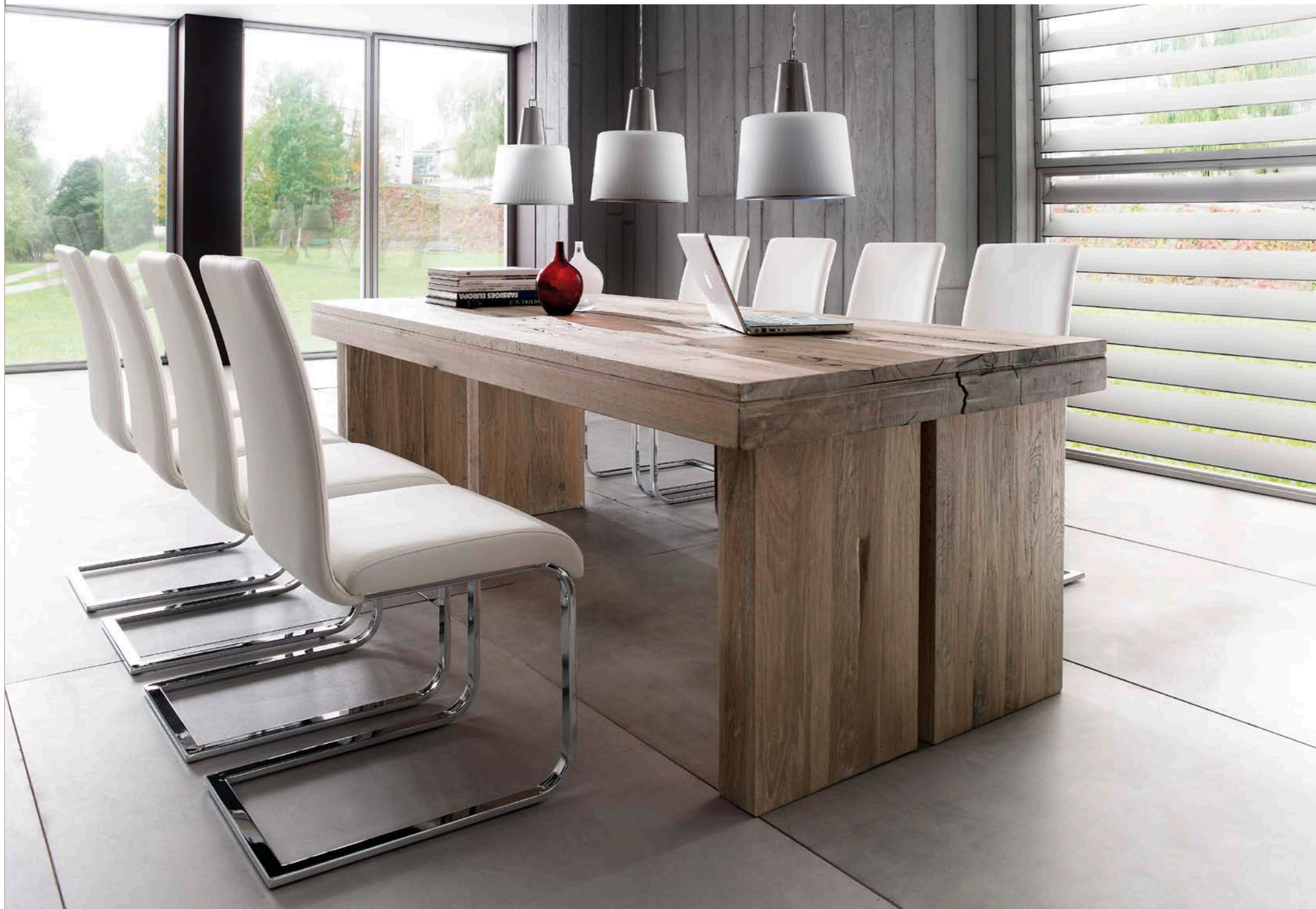
Tisch DUBLIN mit Schwinger LOTTE