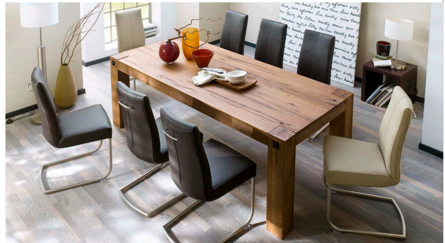
Tisch LEEDS mit Schwinger FLAIR