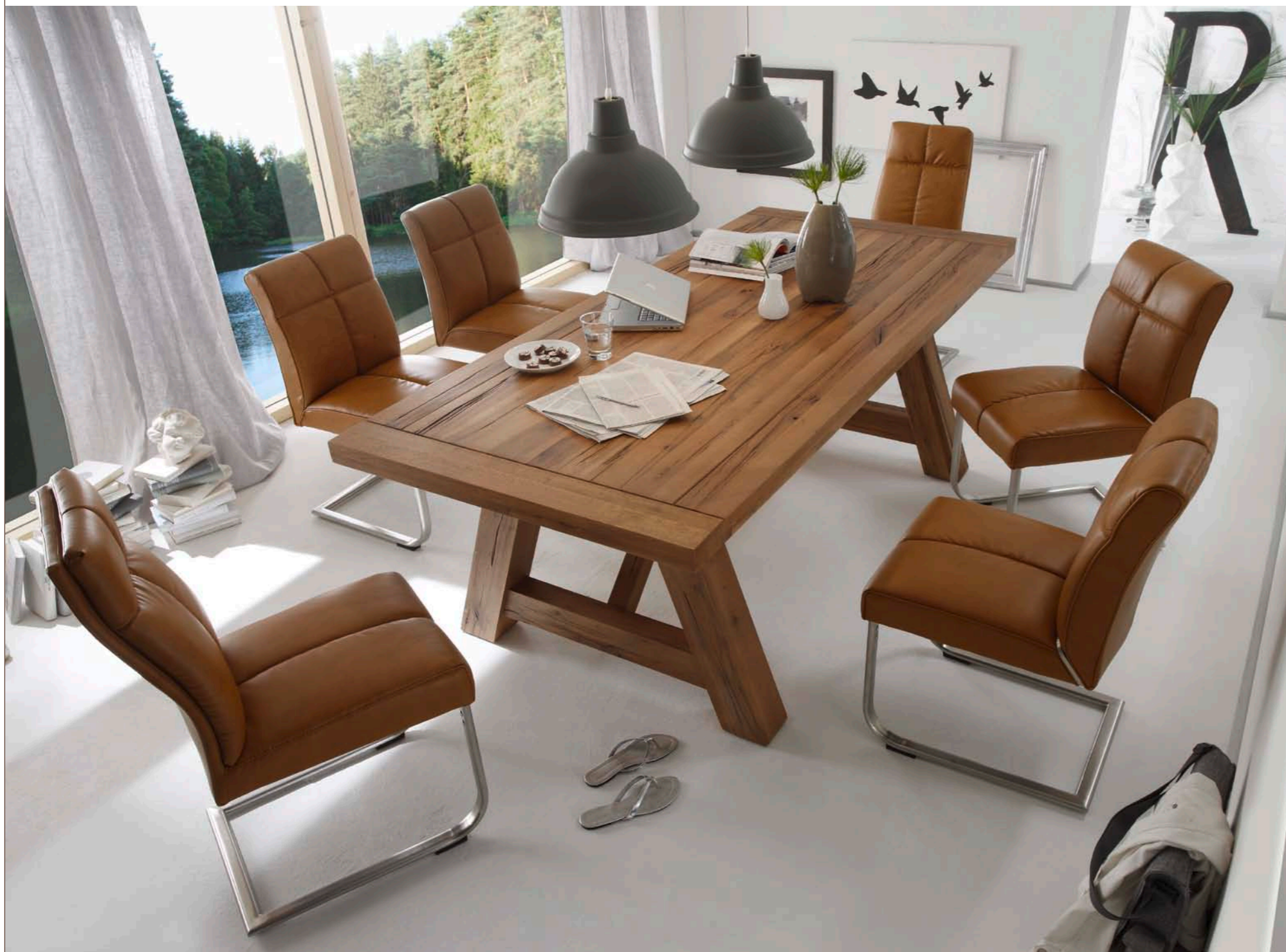
Tisch BRISTOL mit Schwinger LOUNGE A/B/C