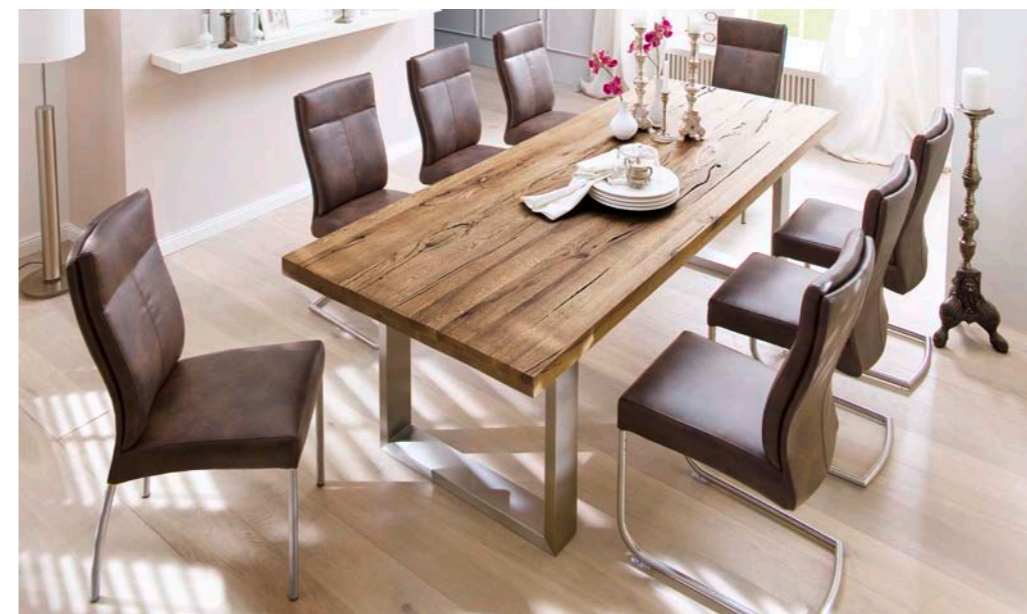
Tisch CASTELLO mit Schwinger CHARLES und Stuhl EDWARD