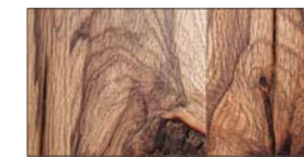
..... W - Wildeiche