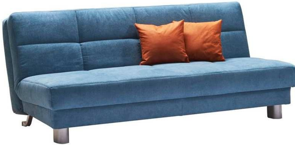
Abbildung:Tilda 180 Bezug 30/3228 Kissen 40/4330