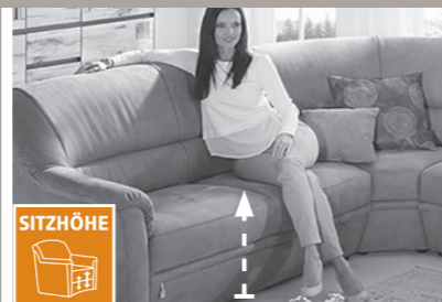
3 Sitzhöhen zur Auswahl

3 Sitzhöhen durch unterschiedlich hohe Möbelgleiter. Nicht möglich bei Funktionselementen. Dadurch ändert sich auch die Rückenhöhe.