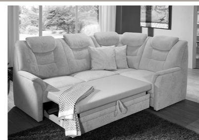
Querschläfer (Mehrpreis, Auszug ist optional im Originalbezug (echt) möglich)