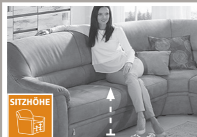
3 Sitzhöhen zur Auswahl

3 Sitzhöhen durch unterschiedlich hohe Möbelgleiter. Nicht möglich bei Funktionselementen. Dadurch ändert sich auch die Rückenhöhe.