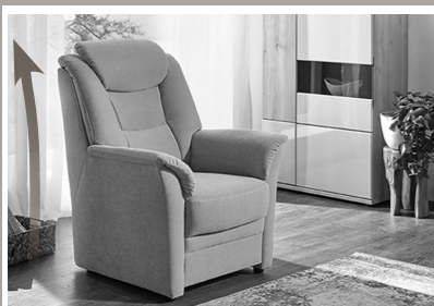
Extra hohe Rückenlehne