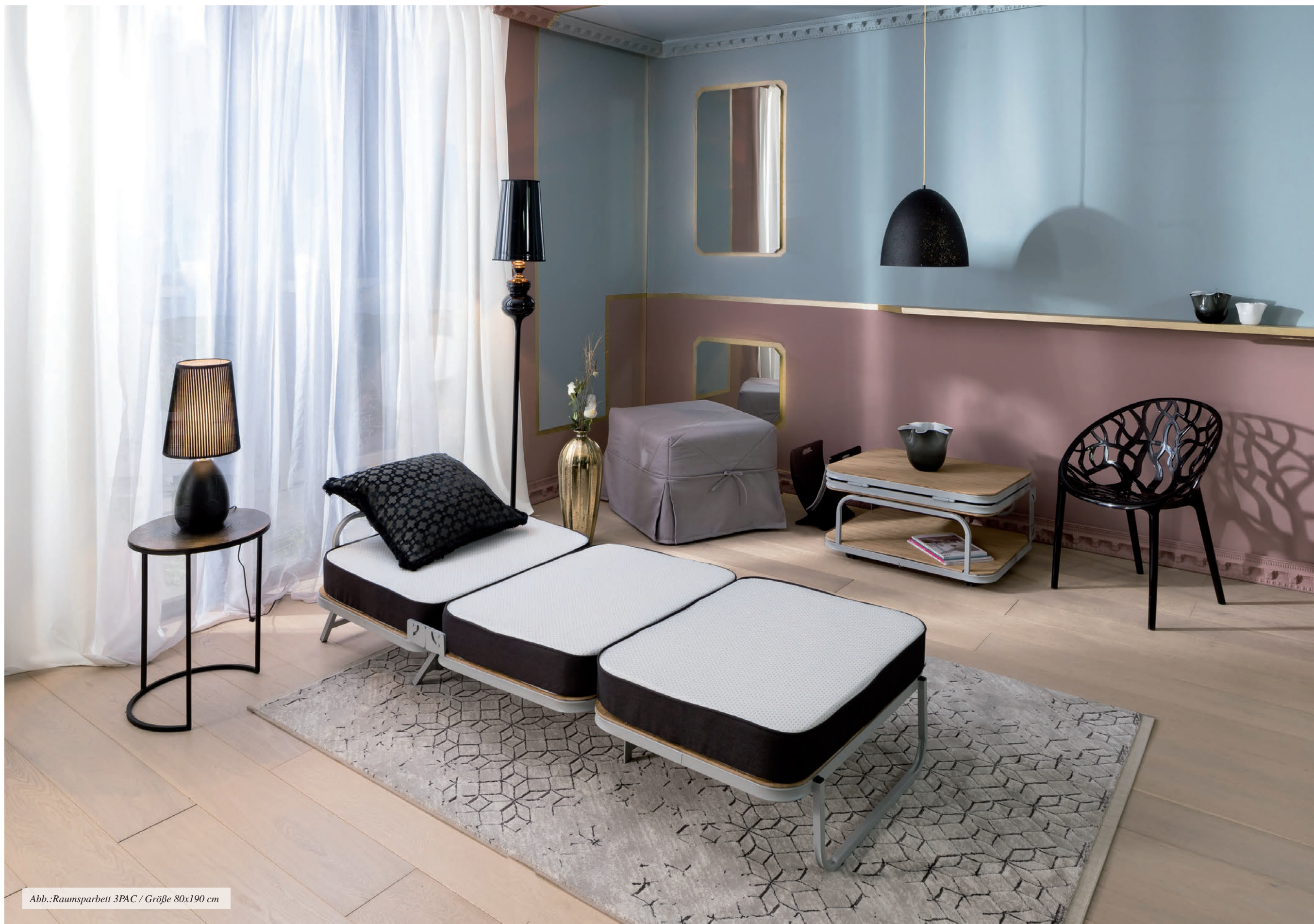
Abb.:Raumsparett 3PAC / Größe 80x190 cm