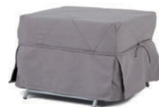
Husse für das Raumsparbett 155.00- Grau