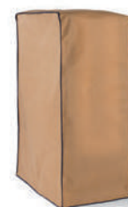
Husse für Raumsparbett Beige