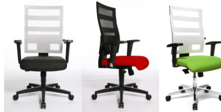
950T T203 950T T310 959T T353