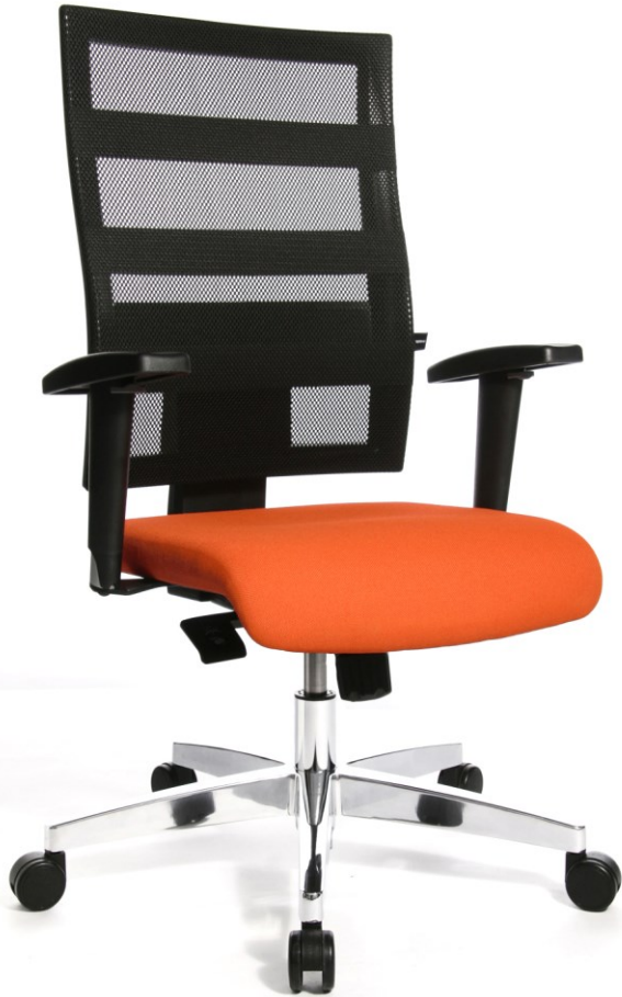
Abb. in Ausführung 959T T340